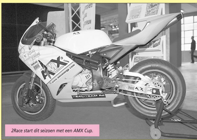
2Race start dit seizoen met een AMX Cup.